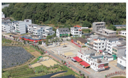
【连樟村党群活动中心】