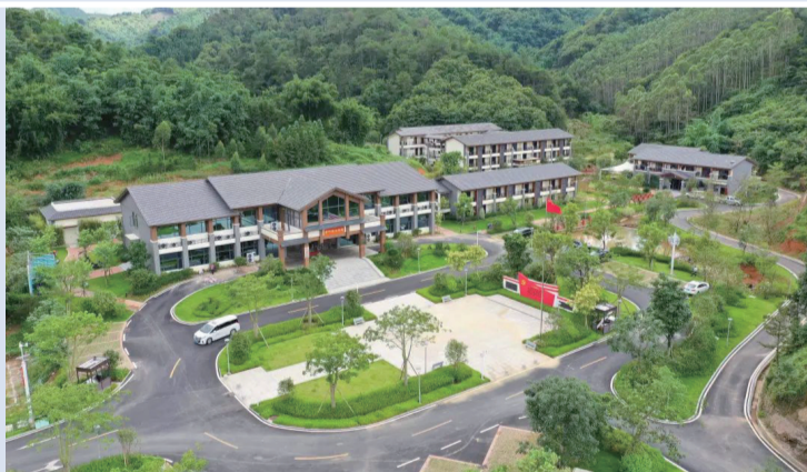
【连樟乡村振兴学院】