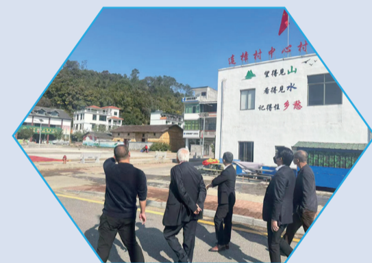
【置身村中，如同身在景区。】

产业园结合当地美丽乡村建设，发展果蔬采摘体验、农业科普教育、农业旅游观光，促进三产融合。其中，采用日本GRA草莓无土栽培技术，主要种植月美西瓜、草莓、水果黄瓜、樱桃番茄等优良品种，2020年园区农产品销售产值717万元，全年总产值达920万元。项目落地后，直接带动30户村民在家门口就业，月工资3500元。通过常态化的新型职业农民培训，更多村民掌握现代农业新技术。而企业与村民5年联合运营，也培养了一批当地致富能手，辐射带动更多农户一起增收。