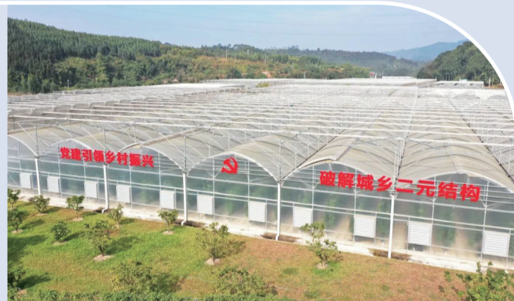
【连樟现代农业产业园】