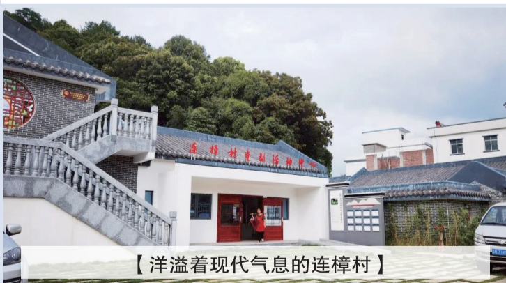
【洋溢着现代气息的连樟村】