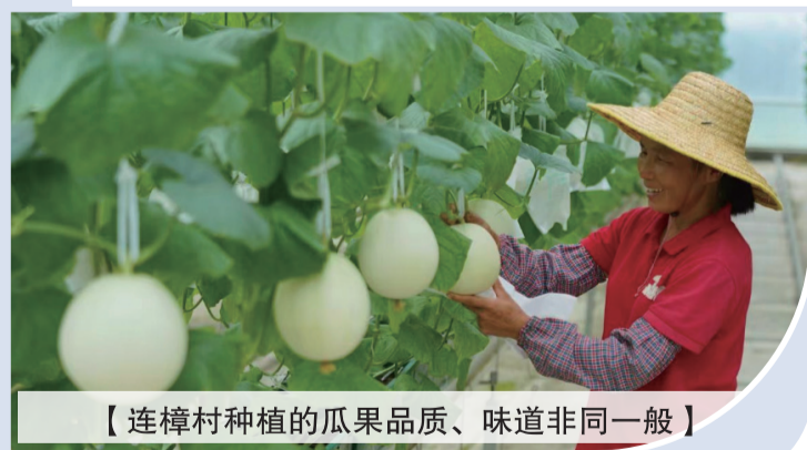
【连樟村种植的瓜果品质、味道非同一般】